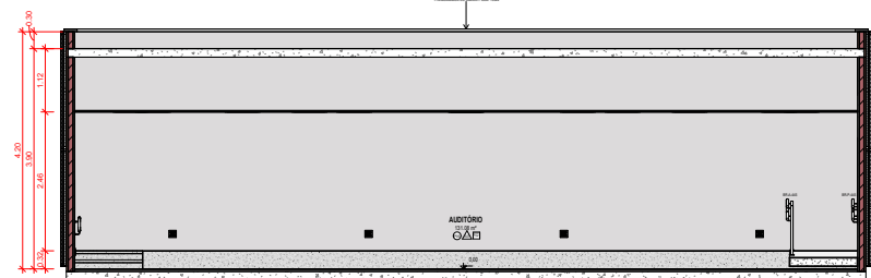
3 CORTE C ESCALA 1:50